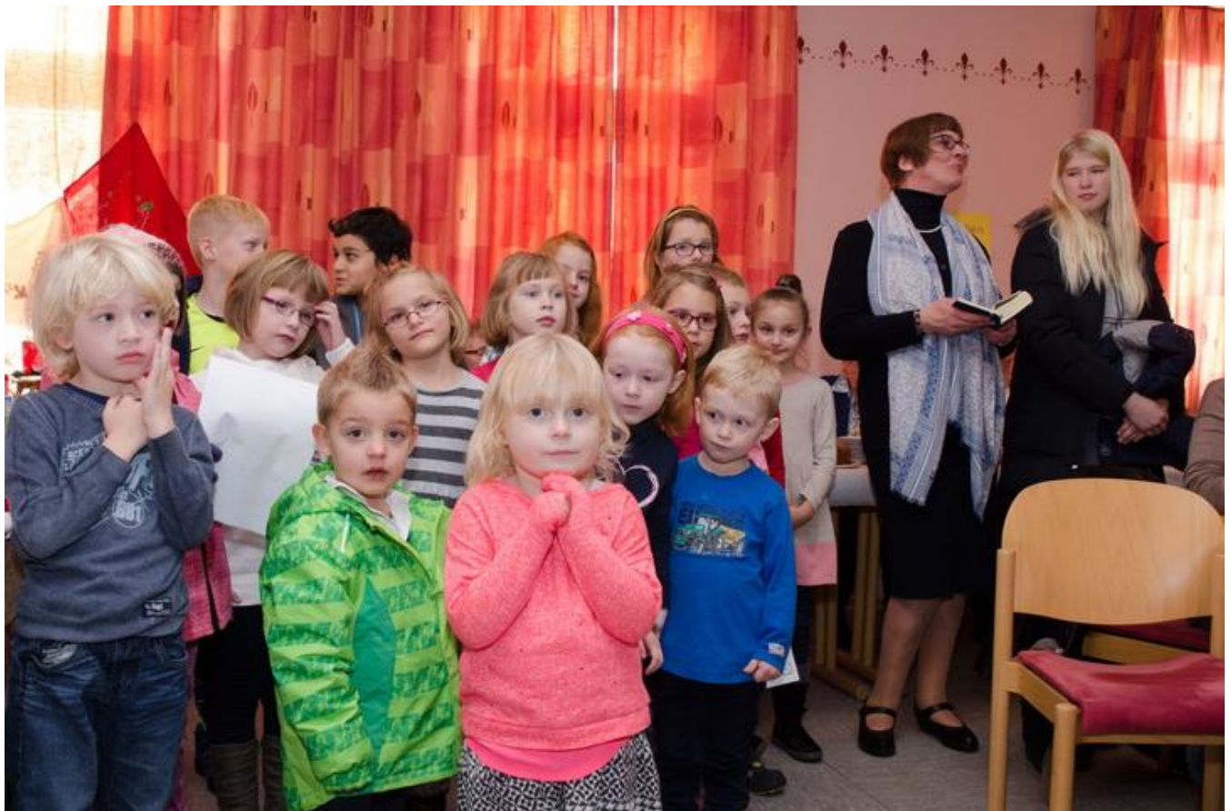
Die Engel legen los und eröffnen den Basar

für die Gestaltung des 1. Adventswochenendes! Die bewährte Kombination am Sonntag von Gottesdienst mit anschließendem Basar mit Gästen im Gemeindehaus ließ viele Besucherinnen und Besucher zusammenkommen und hat einen gelungenen Auftakt der Adventszeit entstehen lassen. Das Kinderrätsel mit den kleinen Fehlern in der Adventsdekoration lockte viele kleine Rätefüchse und es wurden viele richtige Lösungen abgegeben, so dass die Sieger durch das Los ermittelt werden mussten. Trostpreise. Über 3200 € gingen bereits vor Redaktionsschluss für Brot für die Welt ein!