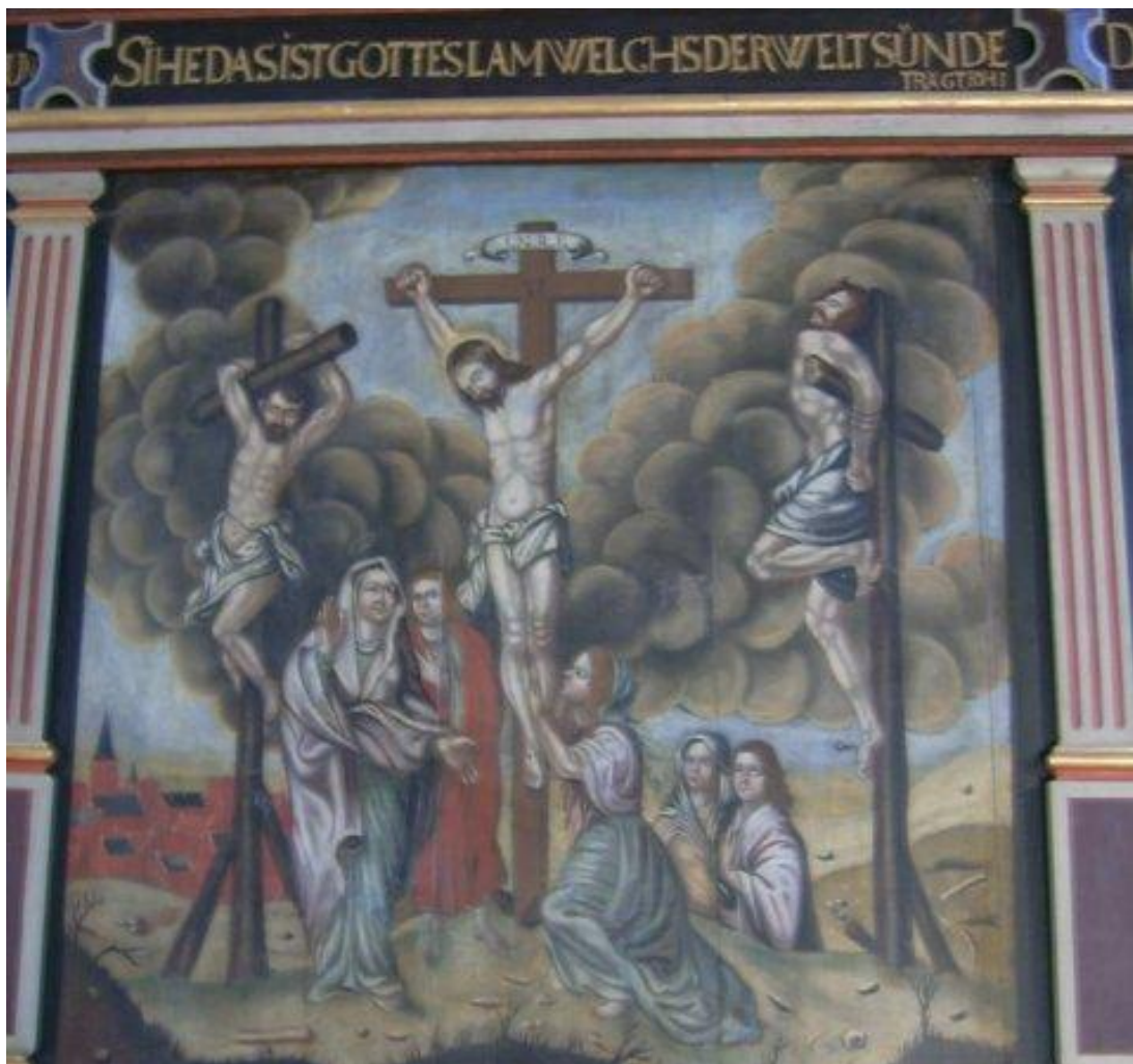
Kreuzigungsdarstellung von Meister Marten an unserem Altar