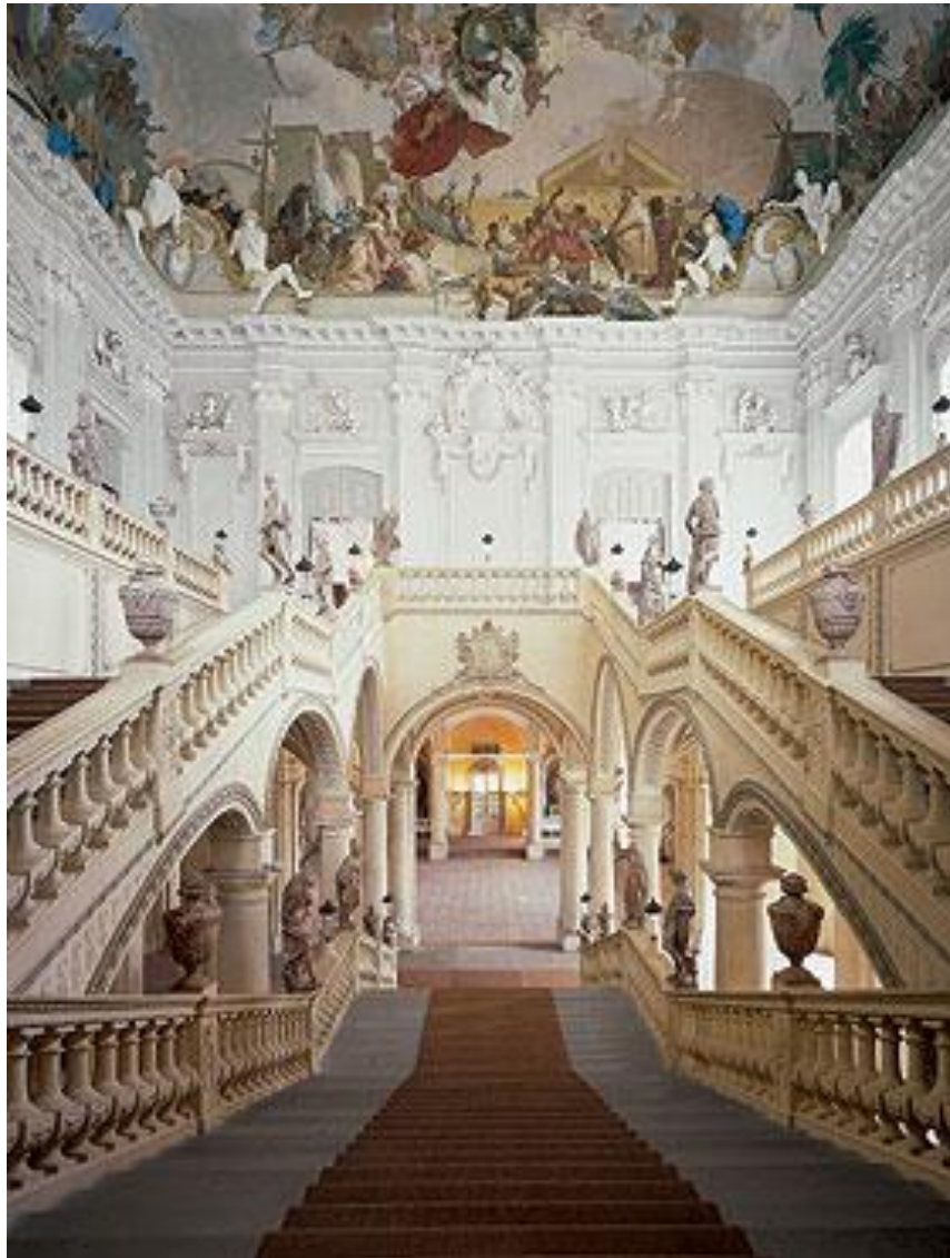
Die Würzburger Residenz: eines unserer Ziele

Wer noch mitfahren möchte nach Marktbreit im Frankenland (11.-16.5.2014), möge sich bitte bald im Gemeindebüro melden!