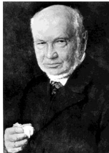
Friedrich von Bodelschwingh, der „Vater“ Bethels.

Der Vorstand des Fördervereins der Kirchengemeinde Victorbur