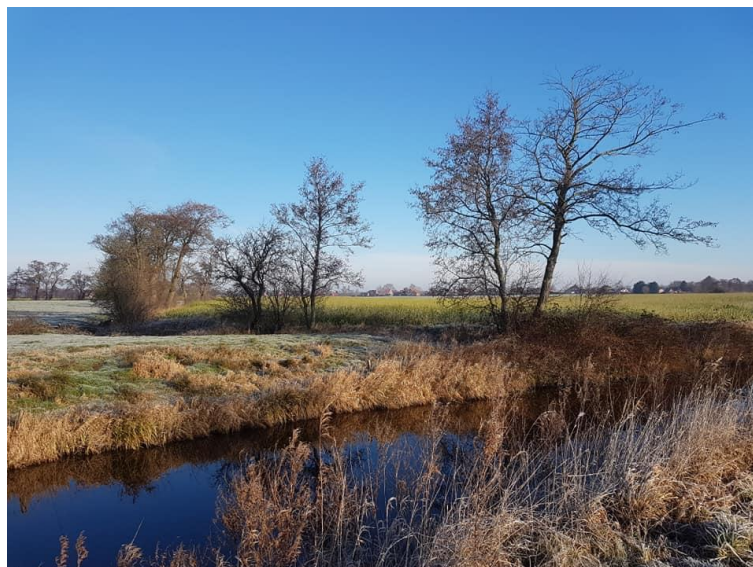
Victorbur im Januar 2020

Der Plattdeutsche Arbeitskreis trifft sich am 19. Februar 2019 um 20.00 Uhr zur Vorbereitung des plattdeutschen Sonntages am 8. März.