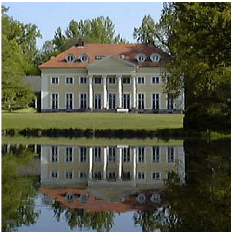
Unser Quartier in Hofgeismar

Der Reisepreis beträgt inkl. Verpflegung 350,00 Euro pro Person. Bitte melden Sie sich bei Interesse bald an! Informationen und Anmeldung im Büro der Kirchengemeinde ab 09.01.2012 (Tel. 9116-0).