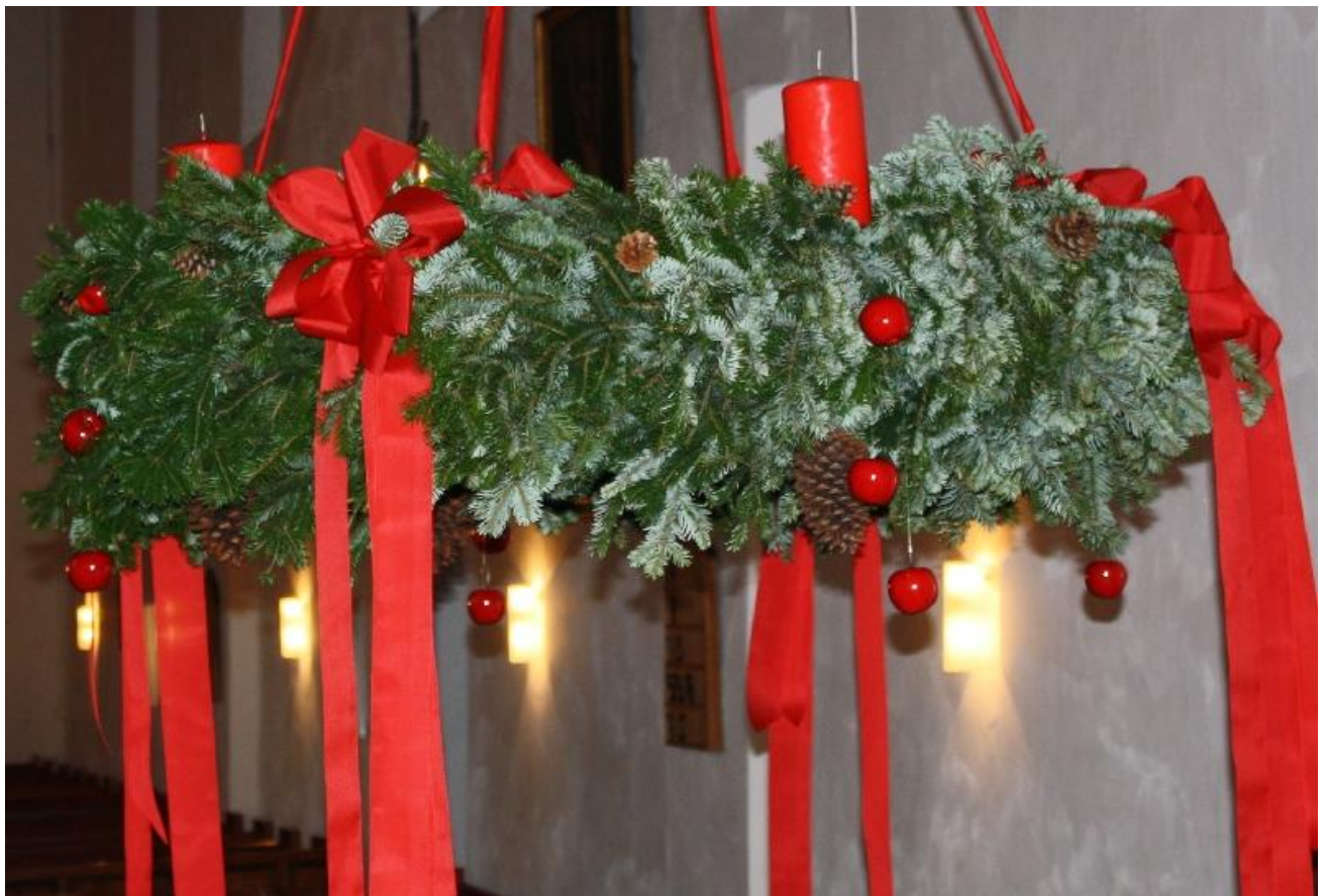
Adventskranz in der St. Victor-Kirche

Danke auch für die Gestaltung der vielen weiteren Gottesdienste, Andachten, Konzerte und Musiken, Teenachmittage usw. zur Adventszeit, an denen viele gerne teilgenommen haben und sich haben einstimmen lassen auf das Kommen des Herrn. Danke für die Liebe und die große Mühe, die von den Vorbereitungsteams in diese Stunden investiert wurde: viel adventliche Freude wurde darin verschenkt.