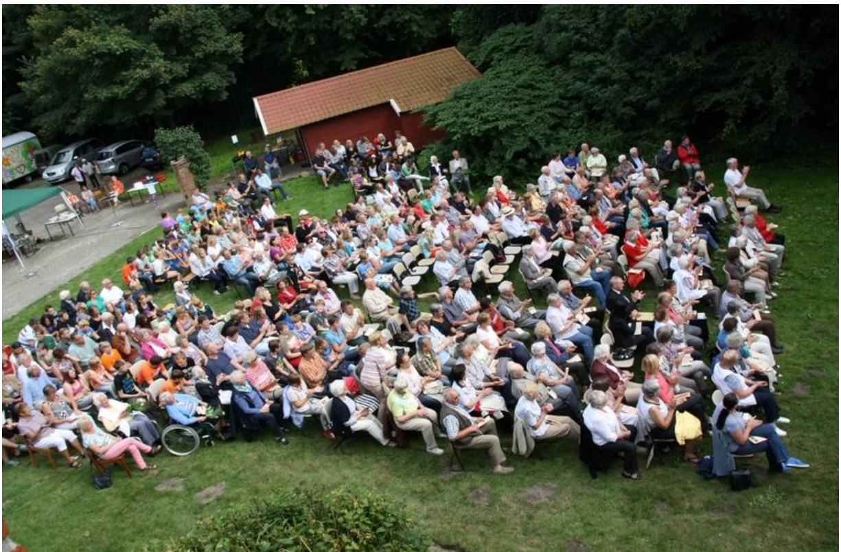
Gartengottesdienst 2014 bei schönstem Augustwetter