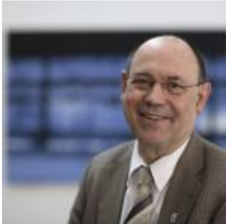
Nikolaus Schneider, Vorsitzender des Rates der Evangelischen Kirche in Deutschland (EKD) zur neuen Jahreslosung auf das Jahr des Herrn 2014