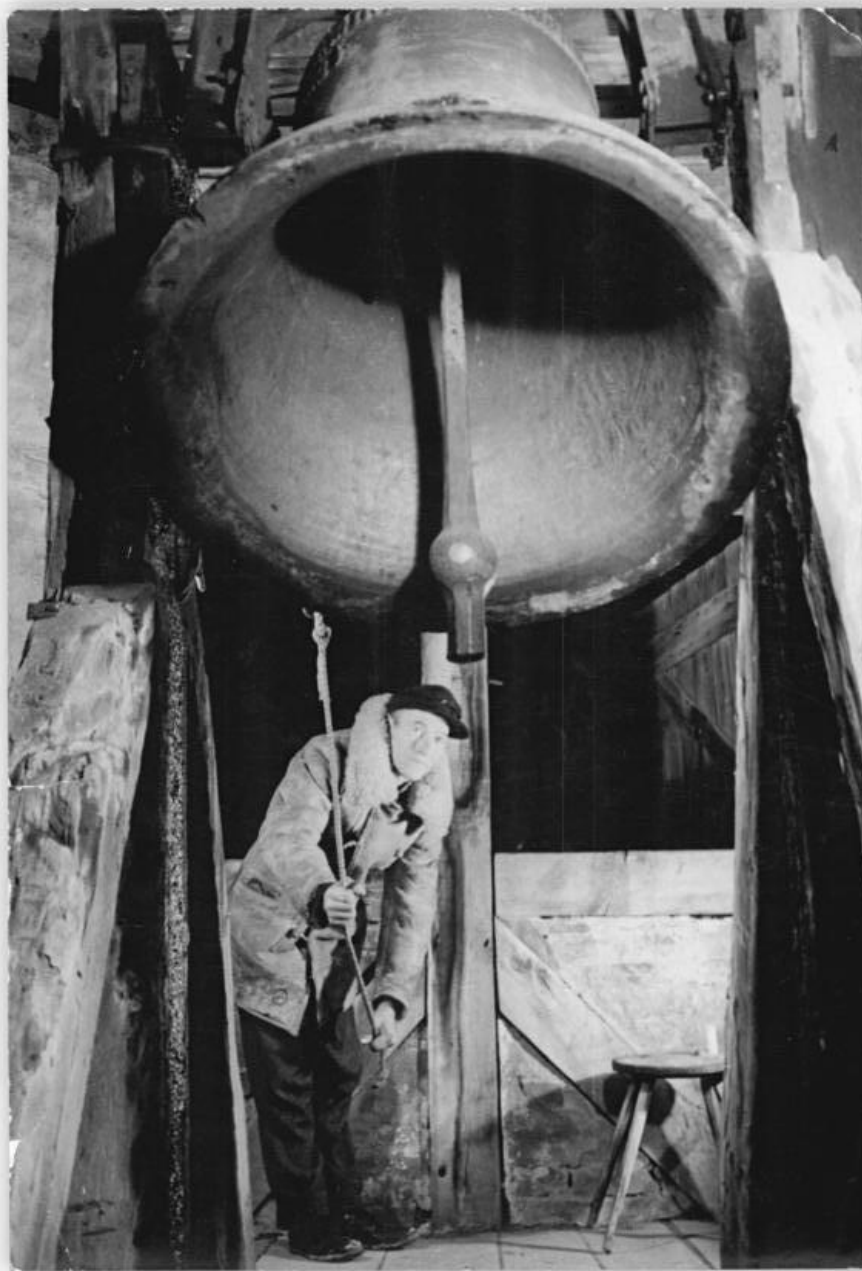
12. Dezember 1954