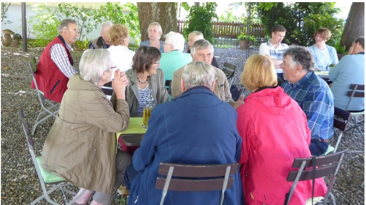
Pause im Biergarten