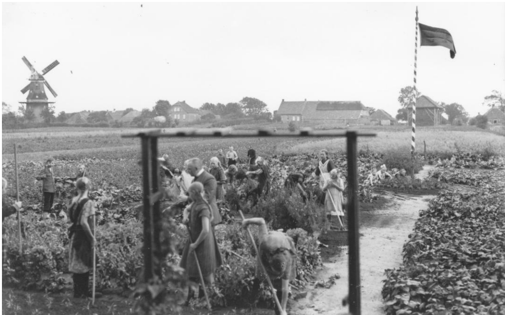
Die Arbeit im Schulgarten mit Blick auf das Nordende von Uthwerdum