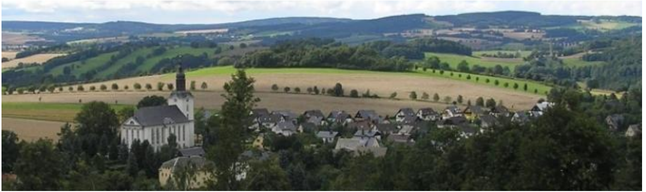
Blick auf Mildenau