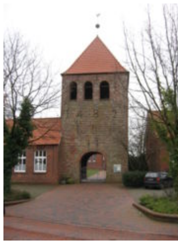
Ev. Ref. Kirchturm Ihrhove

Auch in diesem Jahr geht es wieder weiter mit unseren beliebten Gemeindefahrten. Wir wollen uns wieder einmal drei interessante ostfriesische Kirchen ansehen und dabei etwas über die so ganz verschiedenen Gemeinden lernen, die ihre Gottesdienste darin feiern. Als erste Kirche wollen wir in diesem Jahr die evangelisch-lutherische Gemeinde in Flachsmeer besuchen, fahren dann weiter nach Ihrhove zur altreformierten Gemeinde und reformierten Gemeinde.