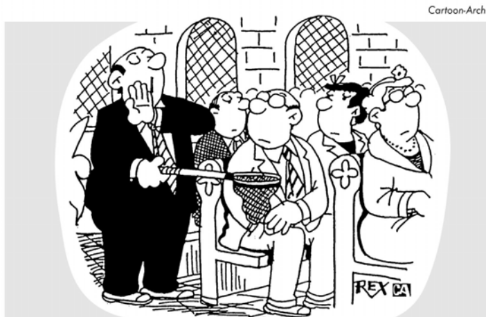
„Achtung, heute ist das Fernsehen da und filmt!“