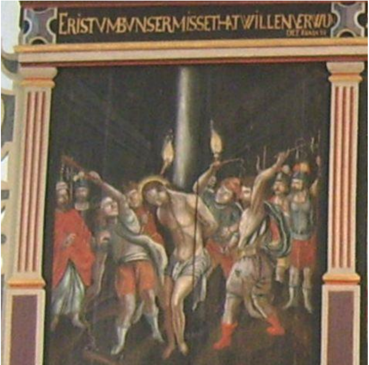
Gemälde des Victorburer Passionsaltars von 1657

Gemeindebrief der ev.-luth. Kirchengemeinde Victorbur 44. Jahrgang 03. Ausgabe März 2015