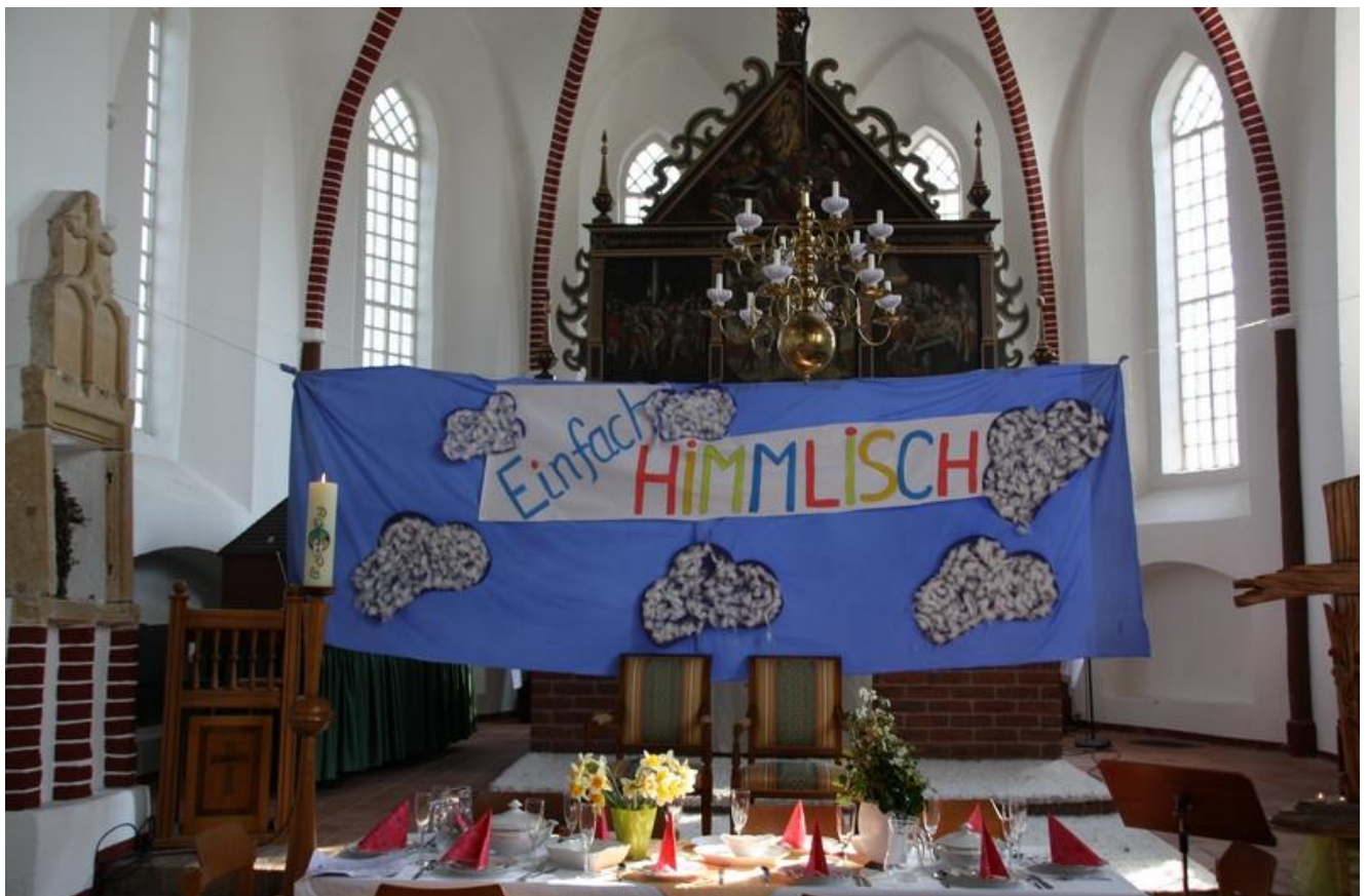
Das war die tolle Deko zum Kinderkirchentag 2014 in der Kirche!

Dieses Jahr wieder zu Ostern (Ostermittwoch 08.04.) kommt wieder unser großer Kinderkirchentag (s. Sonderseite). Dazu noch eine Einladung: wir wollen für den großen Kinderkirchentag ein Team jetzt zusammenstellen. Wäre das nichts für Euch? Auch wer noch nie mitgemacht hat, wird von der Vorbereitung und von dem Tag selber noch lange zehren. Darum: meldet Euch gerne für das Vorbereitungsteam! Wir freuen uns auf Euch!