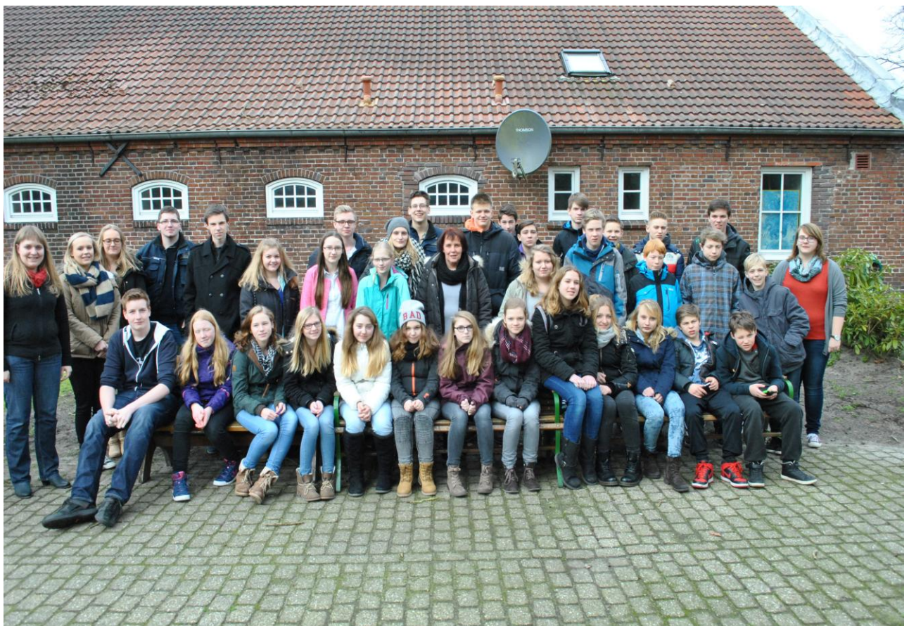
Eine tolle Truppe: Unsere Victorburer Konfirmandenfreizeit 2015

Mit viel Engagement und Herzblut wurde die diesjährige Konfirmandenfreizeit wieder vom Jugendkreis vorbereitet. Wie gut, dass wir die Jugendlichen in unserer Gemeinde haben, sonst wäre gar nicht daran zu denken, unseren Konfirmand/inn/en ein so abwechslungsreiches und schönes Wochenende zu bieten. Als biblischen Hintergrund hatten wir die Josefsgeschichte aus dem 1. Buch Mose und Psalm 139 ausgewählt. Wir danken unseren Jugendlichen ganz herzlich und hoffen, dass unsere diesjährigen Konfirmanden auf den Geschmack gekommen sind und sich in die Jugendarbeit einklinken.