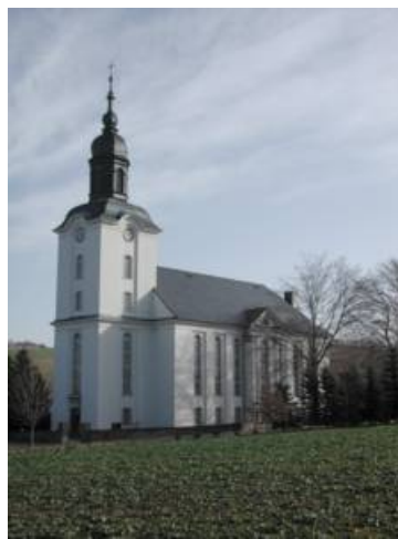
Kirche Mildenaue im Frühling

Gemeindebrief der ev.-luth. Kirchengemeinde Victorbur 37. Jahrgang 06. Ausgabe Mai 2008