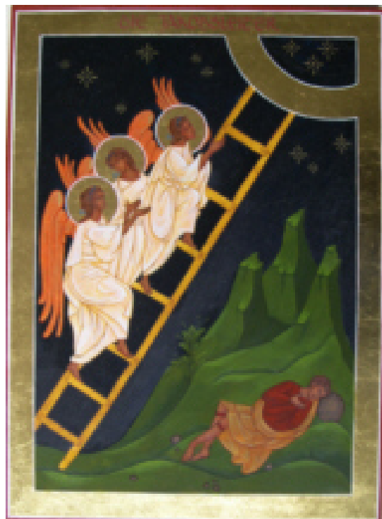
Mittelalterliche Darstellung der Jakobsleiter

An diesem Nachmittag fährt ein Bus der Fa. Harms/Forlitz ab 14.00 Uhr die bekannte Gemeindetour ab und hält an „Ihren“ Haltestellen.