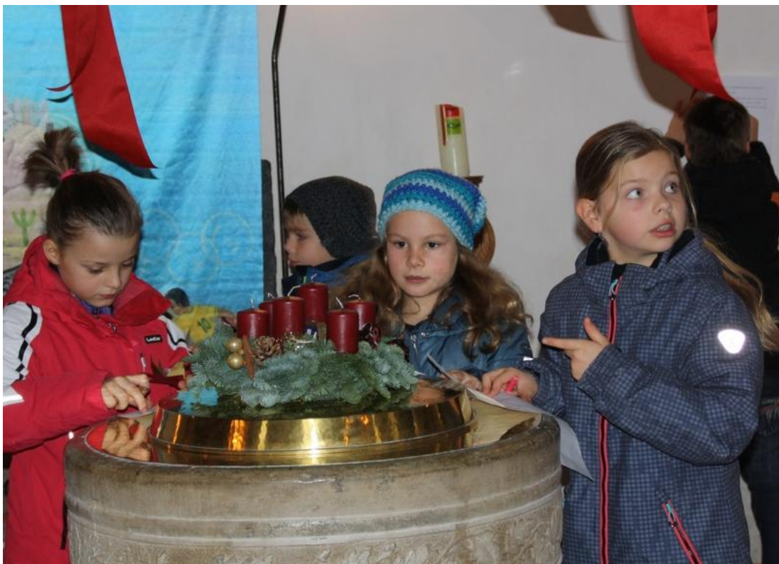
Hier wurde ein Fehler gefunden!

Wir treffen uns am 02.12.2018 ab 10.00 Uhr am Gemeindehaus und feiern dann unseren Kindergottesdienst dort. Direkt im Anschluss an den Kindergottesdienst gibt es wieder ein tolles Rätsel zu lösen: sieben Fehler wurden vom Dekoteam in den Adventsschmuck eingebaut. Wer alle findet, hat die Chance auf einen tollen Preis!