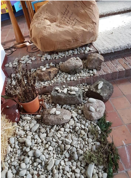
Toll gemacht: Die „dürre“ Seite von 2018 (Ausschnitt)

Einen großen Erfolg in der Unterstützung unseres indischen Patenkindes konnte der Jugendkreis dank Ihrer Hilfe am Erntedankfest bei der Durchführung der Marmeladenbörse verbuchen: Über 500 Euro sind zusammengekommen – das ist eine große Hilfe für die Schul- und Berufsausbildung unseres Patenkindes! Allen Spenderinnen und Spendern, aber natürlich auch unserer treuen „Kundschaft“ sagen wir herzlichen Dank.