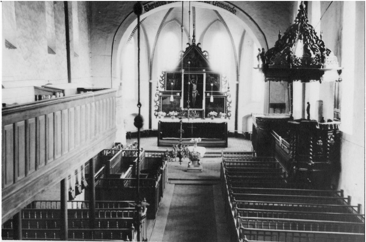
Da werden Erinnerungen wach: Unsere Kirche zur Zeit der Konfirmation 1956

Der Gottesdienst zur Diamantenen Konfirmation wird in diesem Jahr gefeiert am 16. Oktober 2016 um 10.00 Uhr. Im Anschluss an den Gottesdienst findet ein gemeinsames Mittagessen im Gemeindesaal statt, ab 14.30 Uhr gibt es Tee.