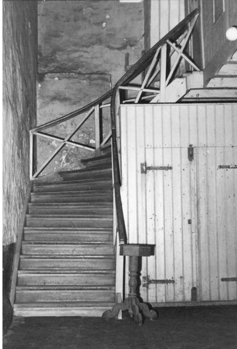
Und ein Bild aus der Zeit vor 60 Jahren: So sah damals der Ausgang zum Orgelboden aus!

Lobe den Herrn, meine Seele, und vergiss nicht, was er dir Gutes getan hat (aus Psalm 103)