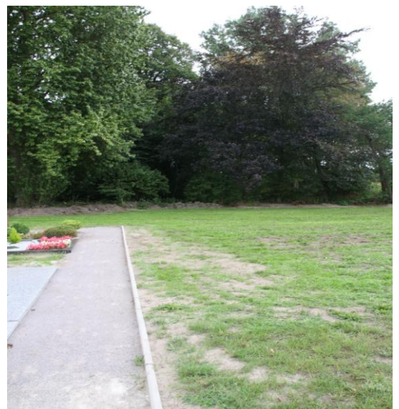
Verlängerung des Gehwegs