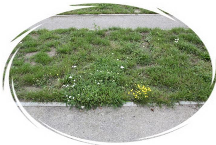
Problem: mehr Unkraut wie Gras

Ein weiterer Stein des Anstoßes war die fehlende Verlängerung des Weges vor der letzten Gräberreihe. Bei Regenwetter mussten Besucher der dortigen Gräber bisher durch nasses Gras laufen. Auf unsere Bitte war die Pflasterkolonne des Fördervereins tätig und hat den Weg verlängert und mit dem südlich an der Friedhofsgrenze verlaufenden Gehweg verbunden.