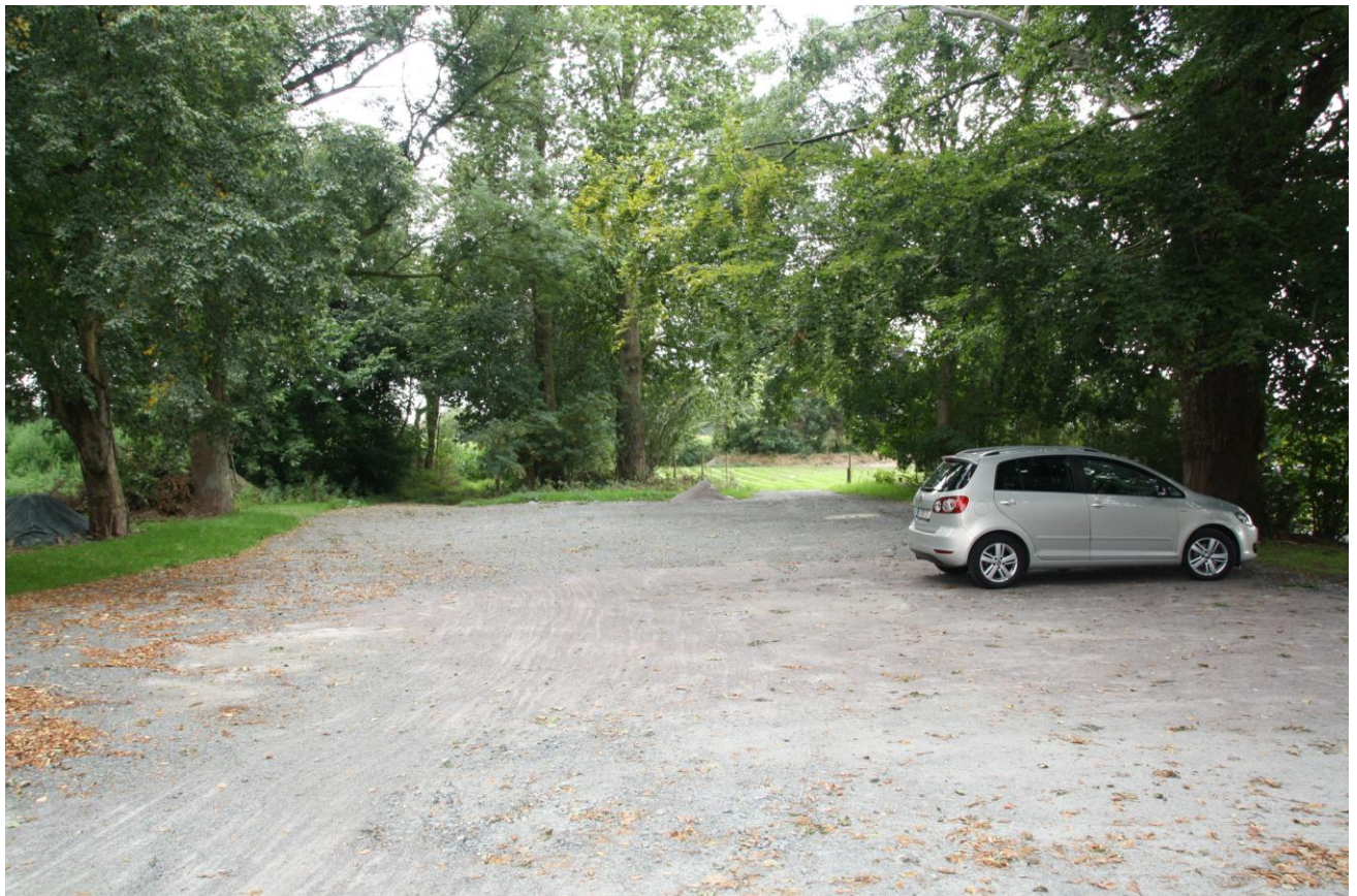
Neuer Parkplatz am Friedhof

ein erster Vorbote unseres Bauvorhabens "Neues Gemeindehaus" ist hinter der Leichenhalle angrenzend an den Friedhof zu sehen: hier ist ein Gelände für zirka 26 Parkplätze entstanden. Denn: das neue Gemeindehaus soll auf dem bestehenden Parkplatz neben dem vorhandenen Gemeindehaus errichtet werden. Um einer Parkplatznot während der Bauzeit vorzubeugen, hat sich der KV für diese Maßnahme entschieden. Friedhofbesucher bitten wir, vom neuen Parkplatz gerne Gebrauch zu machen, insbesondere wegen der angenehmen Beschattung.