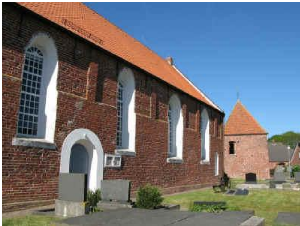
Warfkirche von Freepsum

Wir starten um 13.30 Uhr und besuchen die Kirchen von Norden, Freepsum und Groß-.Midlum EINSTIEG FÜR ALLE an unserer Kirche!