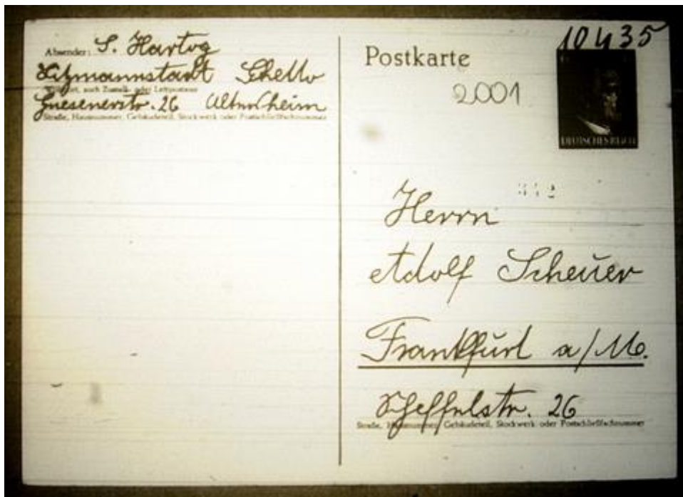
Zweite erhaltene Postkarte von Sara Hartog