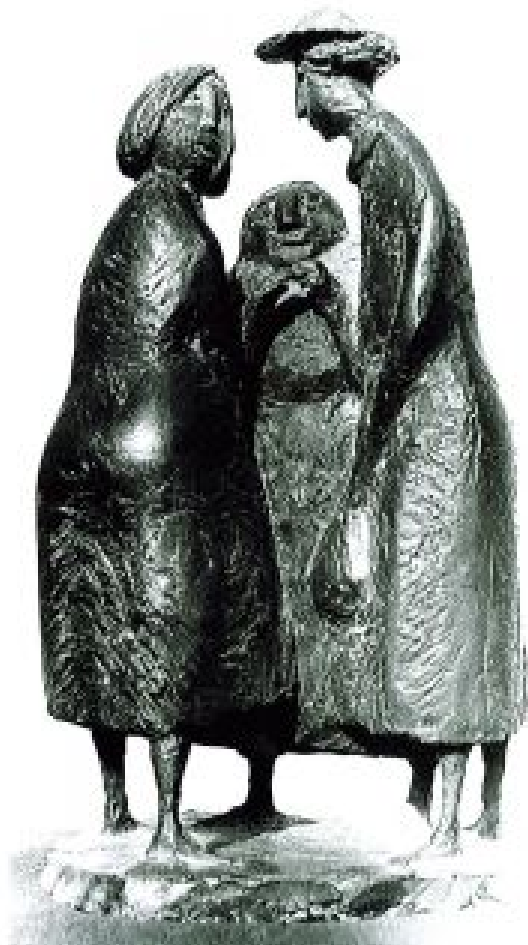
Bronzeplastik von Volker Beier 1971