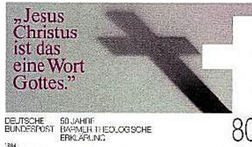
Briefmarke 50 Jahre Barmer Theologische Erklärung