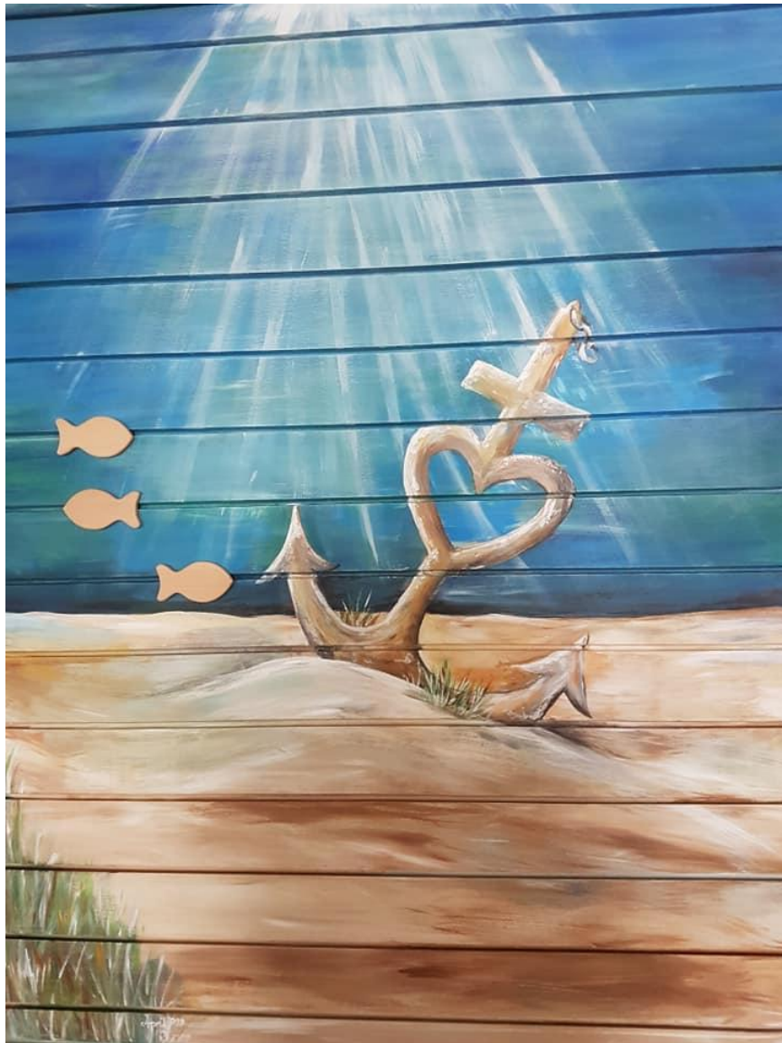
Unser neues Taufbild in der Kirche

Gemeindebrief der ev.-luth. Kirchengemeinde Victorbur 48. Jahrgang 06. Ausgabe Juni 2019