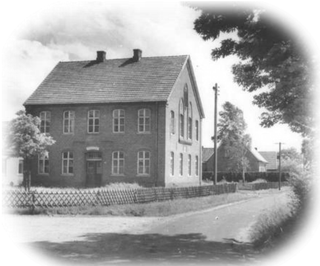
Die Missionsschule Strackholt

Wie ging das zu? Was waren ihre Beweggründe? Welche Missionsgesellschaften unterstützen wir heute?