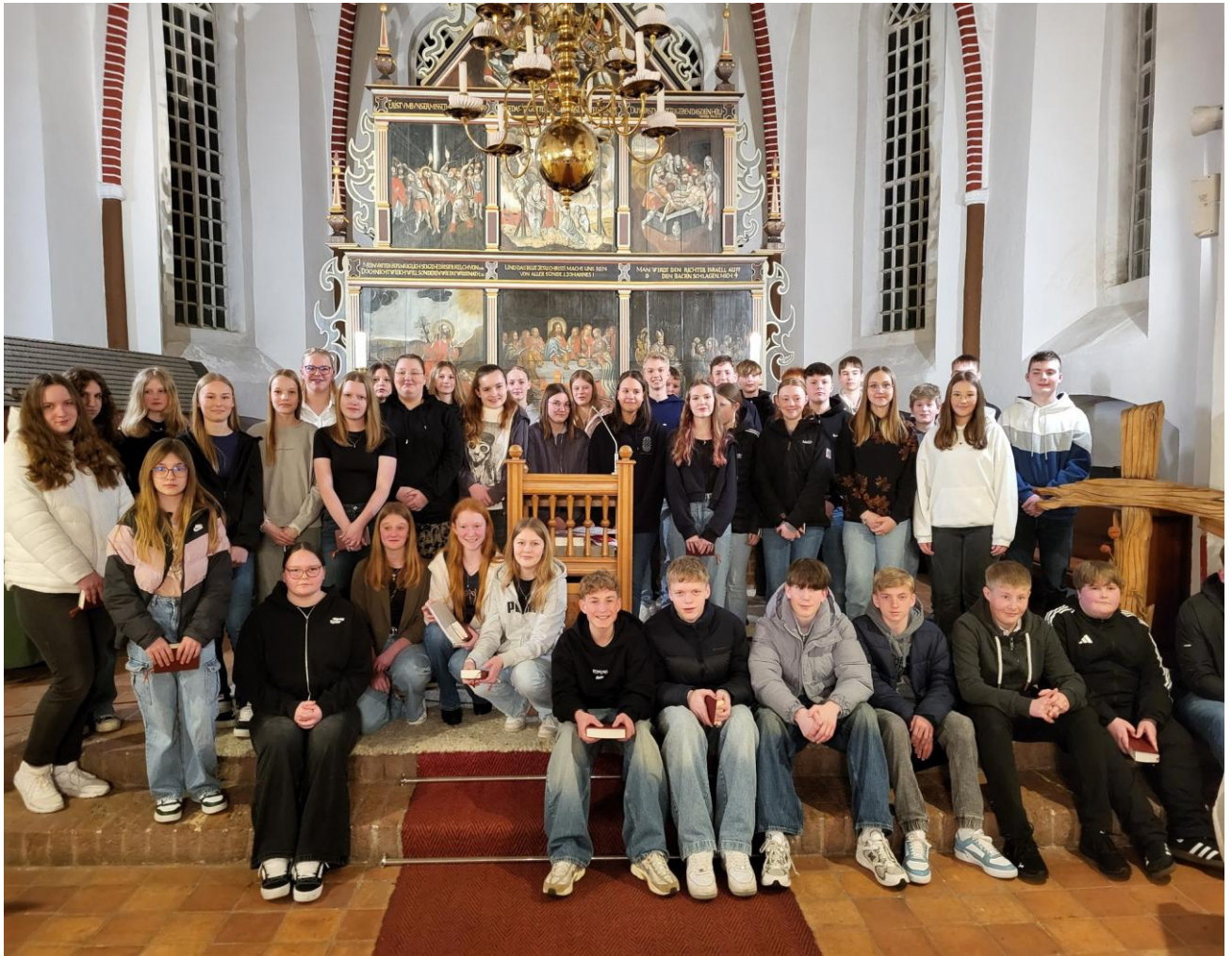
Alle auf einen Blick: unser Konfirmationsjahrgang 2025