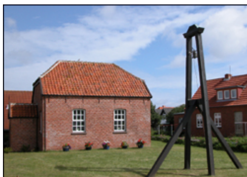
Das Bild zeigt die Inselkirche auf Baltrum mit ihrer tollen Glocke.