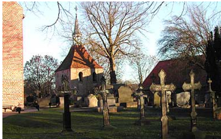
Kirchturm und Friedhof der ev.luth.Gemeinde Holtgaste

Herzliche Einladung zur dritten Gemeindefahrt in diesem Sommer! Wir verknüpfen unseren Besuch in den Kirchen von Pogum, Holtgaste und Nendorp mit einem Streifzug durch die Geschichte des Rheiderlandes – viele kleine Überraschungen und interessante Einzelheiten verbinden sich mit dieser 51. Gemeindefahrt! Fahren Sie gerne mit und steigen Sie ein! Wir sind keine geschlossene Gesellschaft, sondern haben viel Freude an neuen Gesichtern! Wir fahren – so Gott will – auch 2009 weiter und erobern uns die wunderbare ostfriesische Kirchenlandschaft!